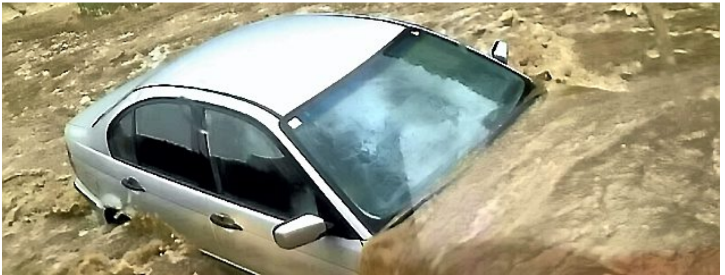
Schwere Unwetter in Birkenfelde am Abend Montag 4. August

Eichsfeld. Massive Schäden hat das Unwetter verursacht, das am Montagabend über das Eichsfeld gezogen ist. Betroffen waren die Orte in den Verwaltungsgemeinschaften Uder und Hanstein-Rusteberg. In 17 Gemeinden mussten die Feuerwehren ausrücken. Besonders schlimm war es in Birkenfelde.