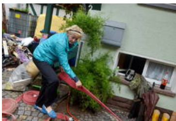
Die Aufräumarbeiten dauern an.

Ortsrand getroffen, die an die Wiesen grenzen, dort füllten sich die Keller zuerst. Die Bürgersteige in der Ortsmitte wurden massiv unterspült. Die Gräben am Ortsrand müssen neu ausgebaggert werden, darum kümmerte sich gestern ein Unternehmen aus Uder. "Die Feuerwehren hatten damit zu tun, die Keller auszupumpen. 50, 60 Einwohner haben geschippt, vier Radlader waren im Einsatz", bilanziert Stadler.